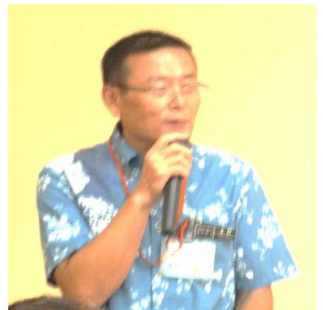
●自衛隊吉村援護課長による卓話