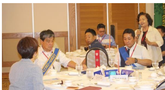
友利会員「以前、来日学生のホストファミリーを しました。とても素晴らしい事業だと思います」