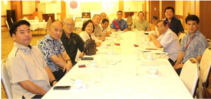
・6/10（月）13:45～14:30 次年度（2024-25年度）第1回クラブ協議会開催しました