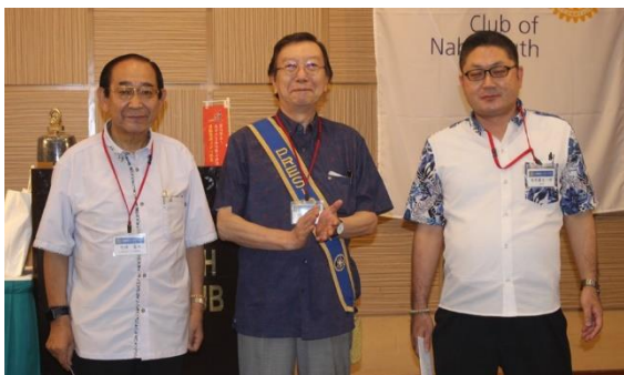
竹林会員我那覇会員 お誕生日おめでとうございます