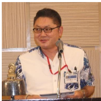
我那覇会員、あいさつ