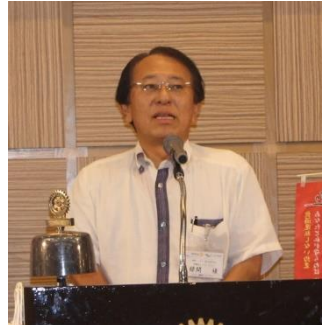
緑間禎AG初のご訪問