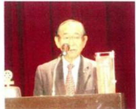
竹林ラーニングリーダー ロータリーの友1月号紹介