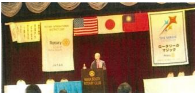
本番に向けてリハーサル