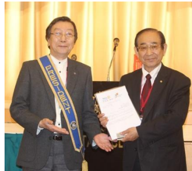
竹林会員へ RLI 修了バッジ授与