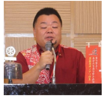
林会員バギオ訪問・パキスタン ポリオワクチン投与活動報告