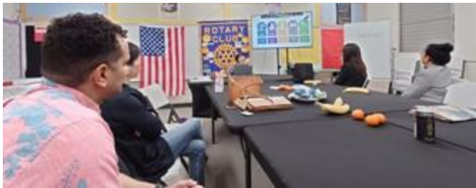
3/7 ホノルルダウタウン RC 例会にメイクアップ